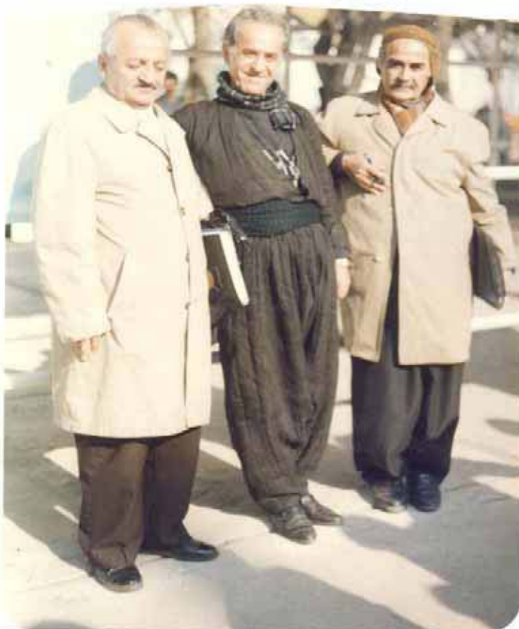
۱- بادی سه‌جادی په‌ره‌ی ۵ و ۶ چاپی ۱۹۸۷ ی زاینی به‌غدا.

۲- ناوی کوردی چاپی ۱۹۵۳- ۳ ریشتهی مرواری ۱ و ۲ و ۳ و ۴ و ۵ و ۶ و ۷ و ۸ که به ته‌رتیب له ۱۹۵۷ و ۵۷ و ۵۸ و ۶۸ و ۷۲ و ۷۹ و ۸۰ و ۱۹۸۳ ی زاینی له چاپ دراوون و به‌رگی ۱ و ۲ و ۳ ریشتهی مرواری له ئیران له لایهن چاپمه‌نی محهمه‌د، محهمه‌دی له‌شاری سه‌قز له چاپ دراوه‌ته‌وه - ۱۱ - گه‌شتیک له کوردستانا چاپی ۱۹۵۶- ۱۲ شو‌رشه‌کانی کورد چاپی ۱۹۵۹- ۱۳- هه‌میشه به‌هار چاپی ۱۹۶۰- ۱۴- ده‌ستورو فره‌ه‌نگی زمانی کوردی ۱۹۶۸- ۱۵- نه‌ده‌بی کوردی و لیکۆلینه‌وه‌ی نه‌ده‌بی کوردی ۱۹۶۸- ۱۶- نرخی شناسی ۱۹۷۰- ۱۷- دو‌چامه‌که‌ی نالی و سالم ۱۹۷۳- ۱۸- کورد (ه) واری ۱۹۷۴- ۱۹- ده‌قه‌کانی نه‌ده‌بی کوردی ۱۹۷۸- ۲۰- خو‌شخوانی ۱۹۷۸. شه‌پۆل *