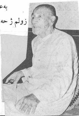
۱- ئەف مسرە عا ژ شیعرا خودی لێخوشبو نالەندەهاتیە وەرگرتن