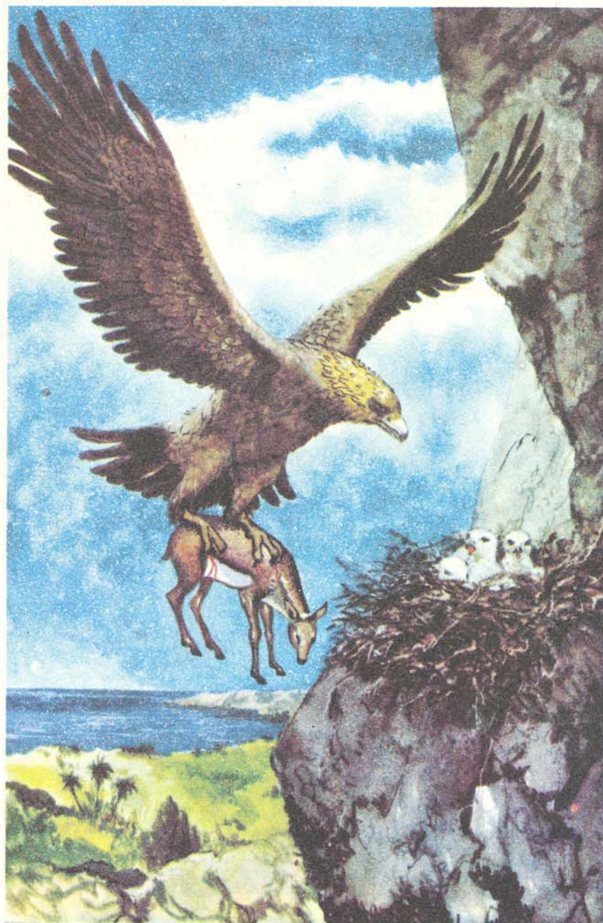
چەن روژنيك بو، بيچوه ناسكه كه له لان دهركه وتبوو هه لۆ رفاندبوى.